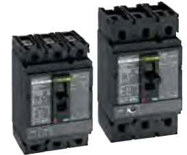
Interruptores Termomagnéticos Marco H y Marco J.