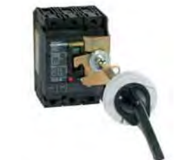
Mecanismos de operación variados.