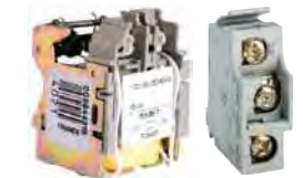
Bobinas y contactos para montaje en campo.